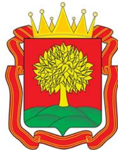
Управление финансов Липецкой области